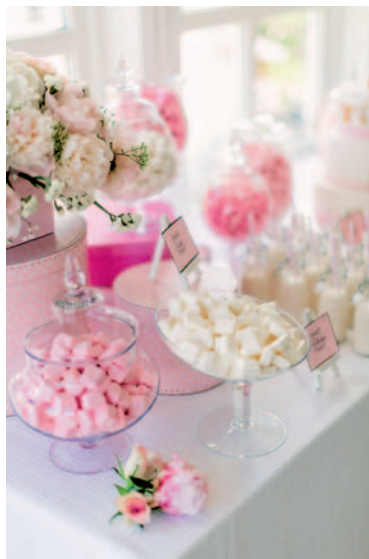
Søstrene Glenne sørger for å gi det lille ekstra under den store dagen.