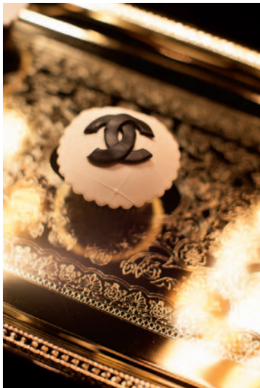
I tillegg til å oppfylle brudeparets ønsker, designer Glennewedding ut i fra kundens private ønsker.